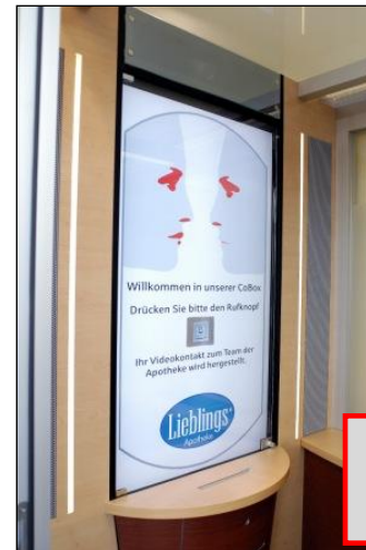
52 Zoll Bildschirm